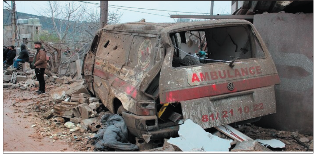
بيروت-سانا استشهاد ٧ مسعفين جراء غارة جوية إسرائيلية على الهبارية جنوب لبنان. معادية استهدفت فجر اليوم مركزاً إسعافياً في قرية

ونقلت وسائل إعلام لبنانية عن جمعية الإسعاف اللبنانية قولها في بيان: "إن غارة استهدفت مبنى في الهبارية يستخدمه جهاز الطوارئ والإغاثة الذي يخضع لإشرافها"، مضيفاً: "إننا نعتبر أن هذا الاستهداف هو جريمة نكراء بكل المعايير، وانتهاك صارخ للقوانين والمواثيق الدولية، ونحمل الجهة المنفذة لهذه الجريمة كامل المسؤولية". من جهته، قال مسؤول في الجمعية: إن أكثر من عشرة مسعفين كانوا في المركز الإسعافي لحظة استهدافه، مشيراً إلى أنه تم انتشار الجثث من تحت الأنقاض، ويواصل العدو الإسرائيلي اعتداءاته على مختلف المناطق اللبنانية، ما أدى إلى سقوط المئات من الشهداء والجرحى، إضافة إلى تدمير العشرات من المنازل والحاق أضرار جسيمة بالبنى التحتية. إلى ذلك، دانت وزارة الصحة اللبنانية القصف الإسرائيلي، مؤكدة أن الاعتداءات على المراكز الصحية تخالف القوانين الدولية واتفاقية جنيف. وقالت الوزارة في