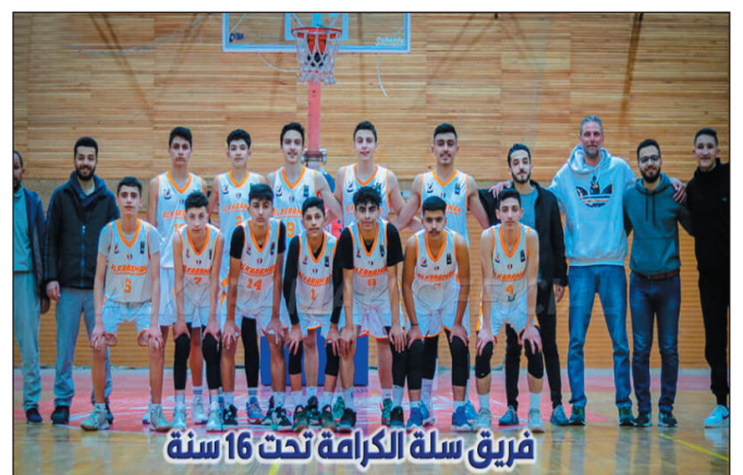
فريق سلة الكرامة تحت 16 سنة

هذه المشكلة ستترك أثراً سلبية سيئة على الفريق الشاب، خاصة وأن كوادر فرق القواعد لم تتقاض مستحقاتها المالية السابقة بانتظار تنفيذ الوعود، وأن الموسم الجديد سيبدأ قريباً مع عقود جديدة ووعود جديدة بأن يتقاضى اللاعبون مستحقاتهم شهرياً، فهل ستنفذ الإدارة وعودها لسلتها الشابة كما تفعل مع سلة الفريق الأول، أم ستبقى الوعود مؤجلة؟