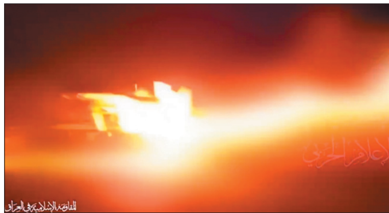
للقوات العراقية في العراق

المجازر الصهيونية بحق المدنيين الفلسطينيين العزل استهدفت المقاومة العراقية فجر اليوم بواسطة الطيران المسير هدفاً حيويًا صهيونيًا في أسدود بأراضي المحتلة.