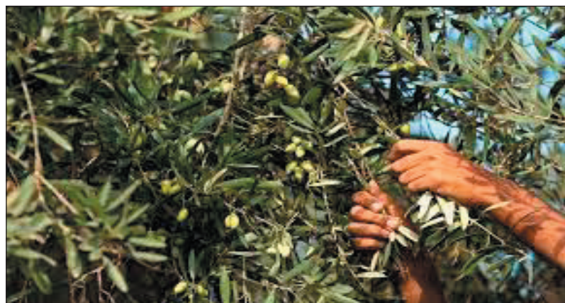
الثاني على مستوى القطر بزراعة الزيتون بعد حصد وتبلغ المساحة المزروعة ٧٥ ألف هكتار وعدد الأشجار الكلي يفوق ١١ مليون شجرة المثمر منها يفوق ١٠ مليون شجرة.