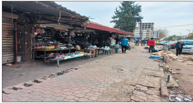
الشعبية الموجودة في ساحتي البرانية والرابية لأنها فقدت الغاية المرجوة منها والموجودة من أجلها.