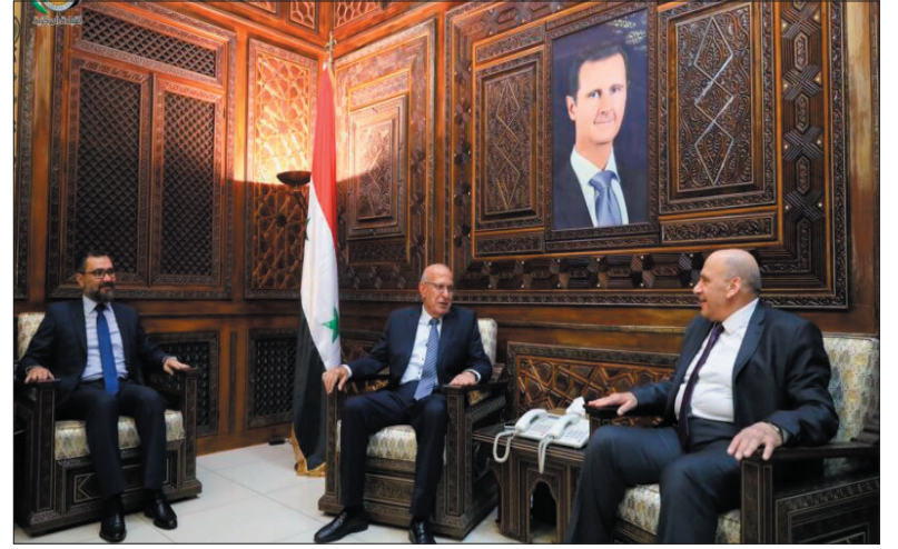
دمشق - ريف دمشق - البعث استقبل الرفيق إبراهيم الحديد الأمين العام المساعد لحزب البعث العربي الاشتراكي وفد الأمانة العامة لمؤتمر

الأحزاب العربية برئاسة قاسم صالح، والقائم بالأعمال في سفارة جمهورية كوريا الديمقراطية الشعبية بدمشق، كما التقى الجهاز الحزبي في فرع ريف دمشق.