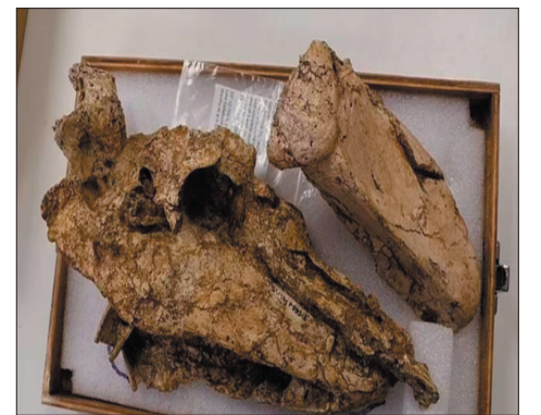
عثر العلماء في أستراليا على جمجمة عائدة لطائر

"جينوريس نيوتوني" العملاق الذي جاب مستنقعات أستراليا منذ حوالي ٥٠ ألف سنة. ويبلغ طول الطائر المذكور حوالي ٦,٥ قدم ويصل وزنه إلى ٢٣٠ كيلوغراماً، بالإضافة إلى أنه يملك أجنحة صغيرة وأرجل خلفية عملاقة. ويعتقد العلماء أن البشر الأوائل في أستراليا تسببوا بالقضاء على هذا الطائر بسبب تناولهم بيضه. وأشارت دراسة حديثة أخرى إلى أنه تأثر أيضاً بأمراض العظام قبل انقراضه منذ حوالي ٥٠ ألف سنة. وتمكن الباحثون من التنقيب عن جمجمته في الطبقات المالحة والجافة لبحيرة كالبونا، وهي منطقة نائية في جنوب أستراليا الداخلية.