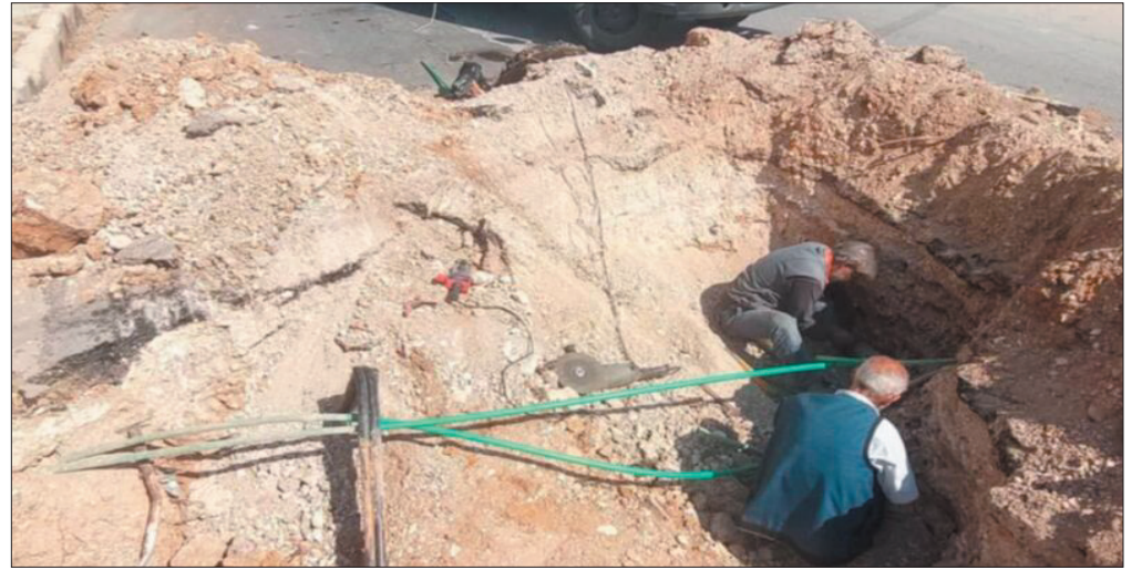
مصادر مياه الشرب في المحافظة عموماً.