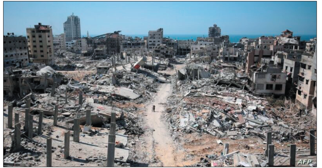
المباني في القطاع لحقت بها أضرار.

وكانت وكالة وفا ذكرت أن طيران الاحتلال قصف مدرسة تؤوي نازحين في حي التفاح شرق المدينة، ما أدى إلى استشهاد سبعة فلسطينيين وإصابة