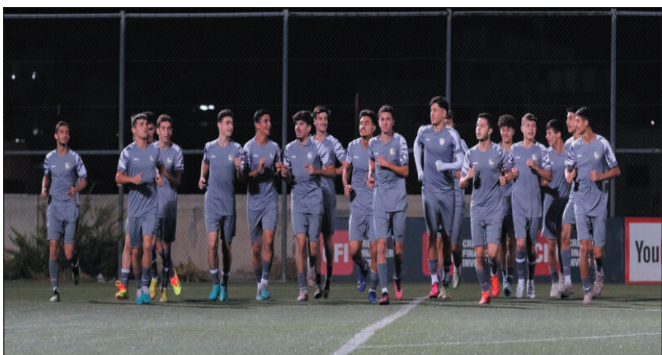
وتقافة الفوز والإقدام لأبطال غرب آسيا ومدربهم الذي بالغ بالأمس بالإحجام عن الهجوم فكانت الخسارة المستحقة.

وإذا أردنا التدقيق بما حصل أمس، وهو بطبيعة الحال ليس نهاية العالم، وربما يكون مجرد عثرة لناشئنا الذين قدموا مستوى مغايراً تماماً أمام المنتخب الأردني، في افتتاحيتهم ضمن التصفيات، فيمكن القول بأنه يجسد ويعكس واقع كرتنا التائهة المتخبطة، أداء مهزوزاً من اللحظة الأولى، وكأنّ تبعاً ظهر أمامنا يؤكد غياب الإعداد النفسي المناسب، وهنا كان مربط الفرس: