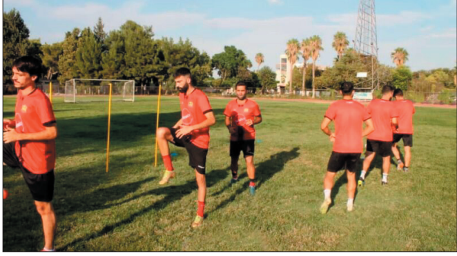
خطة عمل، والفريق وصل إلى حالة جيدة من الاستعداد قبل انطلاق الموسم الجديد.