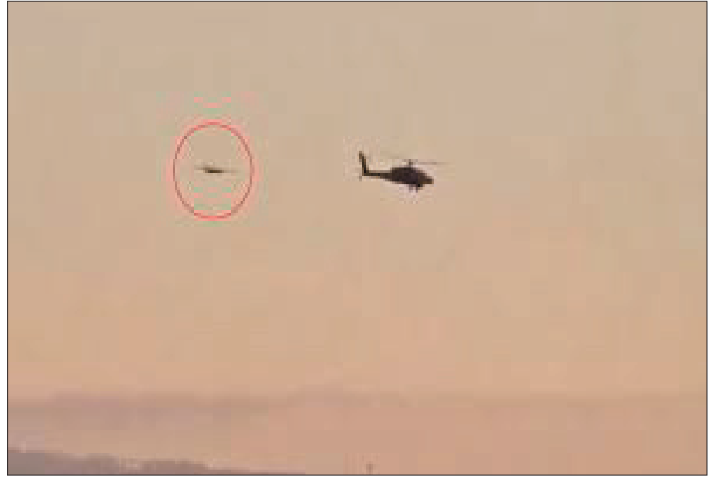
"نتنياهو" وتضرب المنزل بشكل مباشر.

وذكر الإعلام الصهيوني، أنّ جيش الاحتلال يحقّق الآن في فشل نظام صفارات الإنذار، بالإضافة إلى التحقيق في سبب عدم تمكن دفاعاته الجوية من اعتراض الطائرة بدون طيار قبل أن تضرب أحد أبرز الأهداف في البلاد.