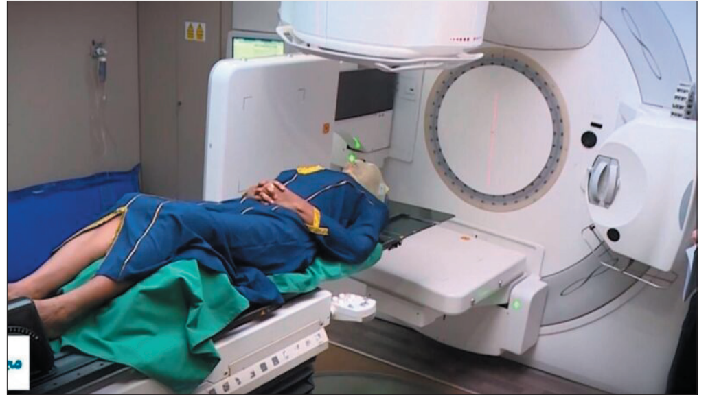
الأكثر شيوعاً بين النساء حول العالم.