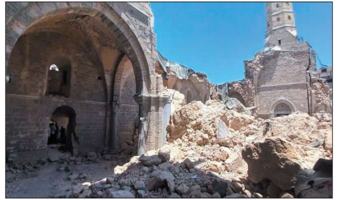
د. معن منيف سليمان

وعلى كل حال، ومع اقتراب الساعة الخامسة كانت وحدات حرس الحدود منتشرة على مداخل القرية، حيث أوقفوا كل شخص عائد إلى القرية وتأكدوا من أنهم من سكان كفر قاسم وأمروهم بالاصطفاف على حافة الطريق وأطلقوا النار عليهم، ثم أخذوا ينتقلون إلى مكان آخر ويوقفون جماعة أخرى من العائدين فيطلقون النار عليهم جماعة تلو الأخرى حتى بلغ عدد ضحايا المجزرة تسعاً وأربعين ضحية من النساء والأطفال والرجال العزل، وقد جنّدت سلطات الاحتلال الصهيوني كل طاقتها وأجهزتها لمنع انتشار خبر المجزرة التي ارتكبتها جنودها، حيث عزلت القرية تماماً، ومنعت تداول خبر المجزرة بالصحف، ولكن مع مرور عدة أيام انكشفت الأمور واضطرت الحكومة الإسرائيلية برئاسة الإرهابي "ديفيد بن غوريون" إلى إصدار بيان في ١١ تشرين الثاني ١٩٥٦، أعلنت فيه: "إنه في ذلك التاريخ أعلن منع التجول للمحافظة على حياة الناس وأن عدداً من الناس الذين عادوا إلى بيوتهم بعد فرض منع التجول أصيبوا