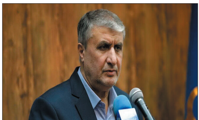
مثل الشهداء السيد حسن نصر الله وإسماعيل هنية وحيي السنوار، وسعى في الوقت ذاته عبر إعلانه المنكر عن مواقف السابقة فيما يتعلق بإعدام الإرهابيين والمجرمين في إيران، لتقديم نفسه كشخصية دولية في مجال حقوق الإنسان، كما أبدى قلقاً بشأن ما يسميه ”حالة حقوق الإنسان“ في إيران.