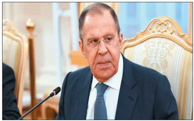
للقوات والمعدات العسكرية في ١٤٠ منطقة، في وقت أسقطت أنظمة الدفاع الجوي ١٩ طائرة مسيرة أوكرانية فوق ٣ مقاطعات روسية.

ميدانياً.. أعلنت وزارة الدفاع الروسية أن قواتها تمكنت خلال الساعات الـ ٢٤ الماضية من تحرير بلدة فيشنيفو في دونيتسك، ودمرت ورشات لإنتاج الطائرات المسيرة، وأسقطت ٤٧ مسيرة على مختلف محاور القتال، وأن الجيش الأوكراني فقد أكثر من ٣٠ جندياً على يد قوات ”الشمال“ الروسية على محور خاركوف، ونحو ٤٦٠ جندياً من قبل قوات ”الغرب“ في مقاطعة خاركوف وجمهورية دونيتسك الشعبية، وواصلت وحدات من مجموعة قوات ”الجنوب“ تقدمها في عمق دفاعات قوات كييف في دونيتسك التي فاقت خسارتها ٥٢٠ عسكرياً، فيما حسنت وحدات من مجموعة قوات ”الشرق“ وضعها على طول خط المواجهة في دونيتسك، حيث فقد الجيش الأوكراني نحو ١٠٥ عسكريين، كما استهدفت وحدات من مجموعة قوات ”دنيبر“ قوات ومعدات عسكرية أوكرانية في مقاطعة دنيبروبيتروفسك وخيرسون وزابورجيه، مكبدة إياها خسائر تصل إلى نحو ٦٠ عسكرياً، كذلك أصيب قطار محمل بمركبات مدرعة تابعة للقوات الأوكرانية ومستودع نفط وبنية تحتية للطائرات العسكرية ومنشآت الطاقة التي يستخدمها الجيش الأوكراني وورشات لإنتاج الطائرات المسيرة، وتجمعات