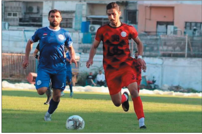
طريقة الفرق في كل مبارياتها، فالخوف من تلقي هدف يجعل الفرق تعتمد على الدفاع أكثر من تفعيل قوتها الهجومية.

على دكة البدلاء، لكنه توقف أمام إرادة الطليعة الذي حقق بإمكانياته المتواضعة نتائج جيدة وضعته بين فرق المقدمة، لغة السواء والانتماء فازت على لغة المال في هذه المباراة، وهي عبء لكل الفرق التي تعتمد على لاعبين أغلبهم من خارج النادي.