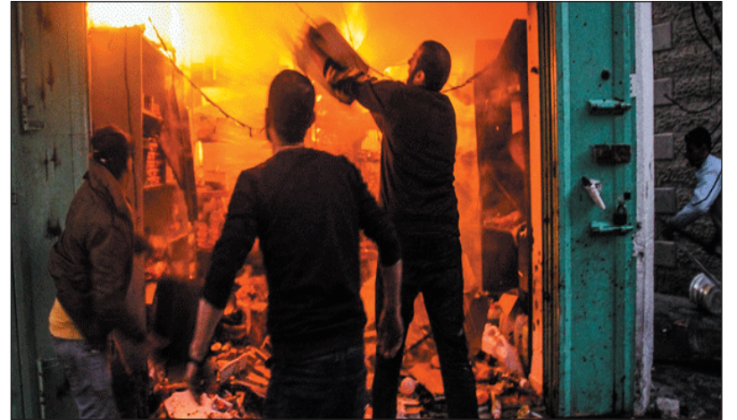
الأرض المحتلة-نيويورك-تقارير استشهد ١٢ فلسطينياً، وأصيب آخرون اليوم إثر قصف الاحتلال الإسرائيلي مناطق في قطاع غزة، وذكرت وكالة وفا أن طيران

الاحتلال قصف منازل في حي تل الهوا جنوب غرب مدينة غزة ومحيط مدرسة تؤولي نازحين في مدينة بيت لاهيا شمال القطاع ومجموعة من الفلسطينيين قرب ملعب في المدينة ومناطق في رفح جنوب القطاع، ما أدى إلى استشهاد ١٢ فلسطينياً وإصابة العشرات، كما قصف الاحتلال بالمدفعية والطيران المسير حيي التفاح والزيتون بمدينة غزة ومخيم المغازي وسط القطاع، فيما أعلنت الصحة الفلسطينية أن الاحتلال الإسرائيلي ارتكب خلال الساعات الـ ٢٤ الماضية مجزرتين في قطاع غزة، وصل من ضحاياهما إلى المستشفيات ٣٦ شهيداً و٩٦ جريحاً، مبيته أن عدد ضحايا عدوان الاحتلال المتواصل لليوم الـ ٤٢٤ على القطاع ارتفع إلى ٤٤٥٠٢ شهيد و١٠٥٤٥٤ جريحاً.